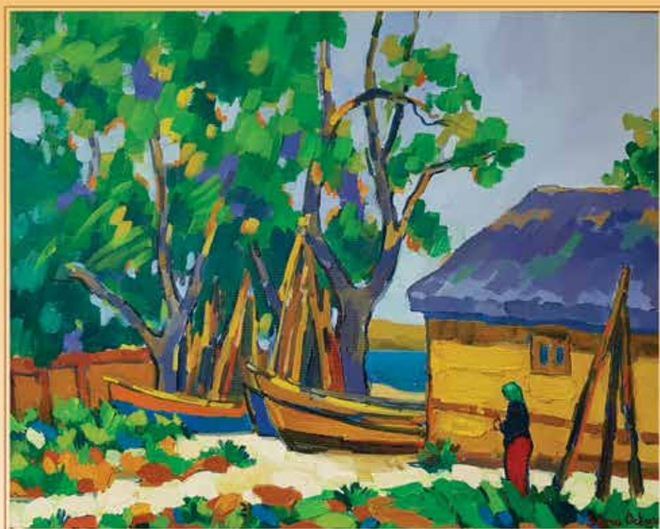
Delta Dunării